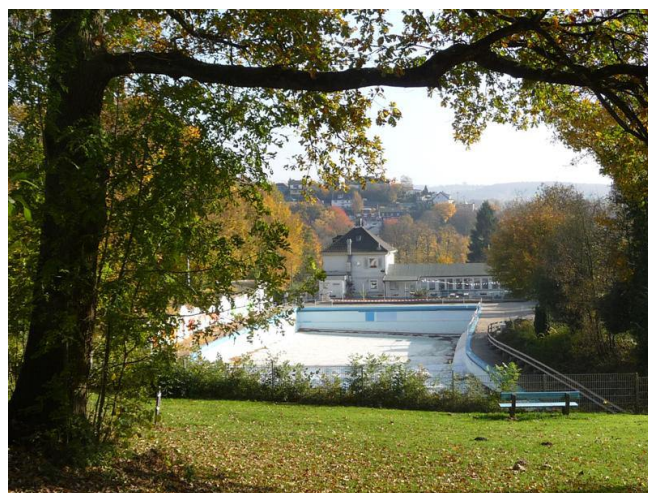
Freibad Mirke Foto v. 30.10.2009