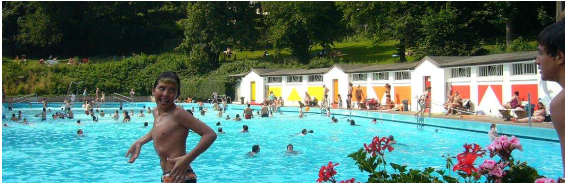
Mirke, Sommer 2009

Im Vorstand des Fördervereins Pro Mirke haben wir daher folgendes Konzept entwickelt: