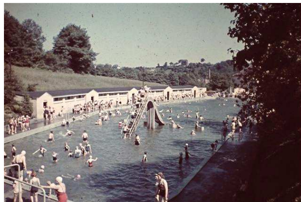
Freibad Mirke 1939

Mo. 22.3., 19 Uhr, Freibadgaststätte "Haus Mirke": Jahreshauptversammlung Förderverein Pro Mirke e.V.