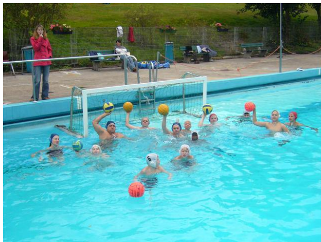
Wasserball, Totenkopf und Schwimmabzeichen Trixi zum Saisonabschluss!

Aktion zum Sommerabschluss: Wasserballspiel zum Mitmachen und Totenkopfschwimmen!