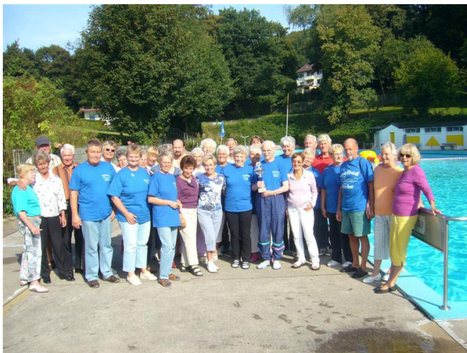
Gruppenbild der Frühschwimmer

26.8.: Die Frühschwimmer feiern ihren Saisonabschluss mit Frühstück am Beckenrand und der Ehrung der Frühschwimmer der Saison 2009